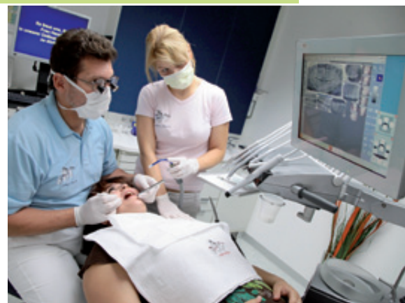
Abb. 1 Bei der Patientenberatung, mit Monitor.

Für Bildschirme stellen die Lichtverhältnisse in der Zahnarztpraxis immer eine Herausforderung dar, sei es durch die Deckenbeleuchtung, das Licht am Stuhl oder durch störende Reflexionen von Wänden und Geräten. Besonders helles Licht herrscht, wenn sich Monitore in