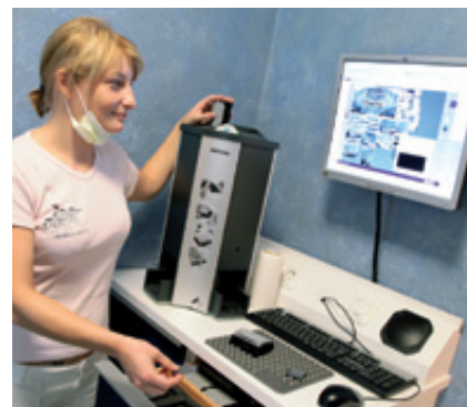
Abb. 3 Assistenz mit dem VistaScan-Scanner.

Räumen befinden, in denen oral- oder implantationschirurgische Eingriffe vorgenommen werden. In unserer Praxis verwende ich Vollspektrumlicht, das dem Sonnenlicht in der Wellenlänge angepasst ist, damit ich Gewebestrukturen, Transluzenzen sowie Farbnuancen